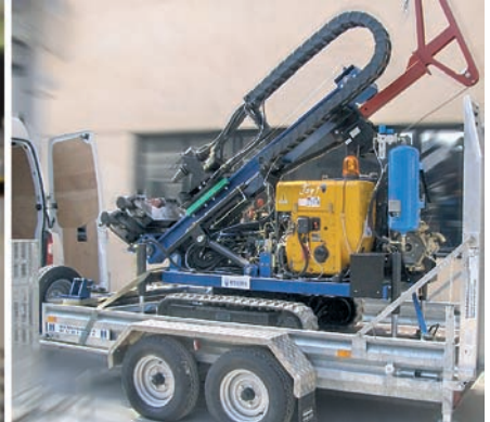
Les dimensions compactes de la perforatrice JOY 1 permettent de la transporter avec un chariot de petites dimensions. Die kompakten Abmessungen der Bohrmaschine JOY 1 erlauben ihren Transport mit einem Gabelstapler kleiner Abmessungen.

Les données et les images figurant dans le présent catalogue sont purement indicatives, Hydra se réserve le droit de les modifier sans préavis. Die in diesem Katalog dargestellten Daten und Abbildungen haben rein exemplarischen Charakter, und Hydra behält sich die Möglichkeit von Änderungen ohne Vorankündigung vor.