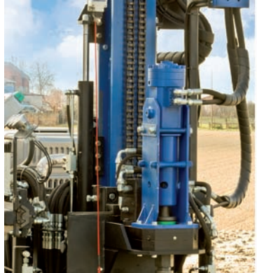
Perforateur rotatif spécial à 2 moteurs et antenne hydraulique allongeable/extensible (+2200 mm). Teilansicht Schlagbohrer mit 2 Motoren und ausziehbarer Hydraulikantenne (+2200 mm).

Die Verwendung dieses Bohraggregats ist auf besondere Weise für alle Unternehmen geeignet, da sie kompakt ausgeführt ist und sich leicht auch mit mittelgroßen Fahrzeugen transportieren lässt. Die Maschine eignet sich speziell für folgende Arbeiten sowohl im Innen- als auch im Außenbereich: • Fundamentaushebungen • Mikropfähle • Zugstangen • Testbohrungen • kleine Brunnen.