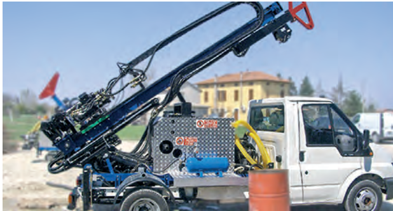
JOY 2 monté sur camion / JOY 2 auf Lastwagen montiert