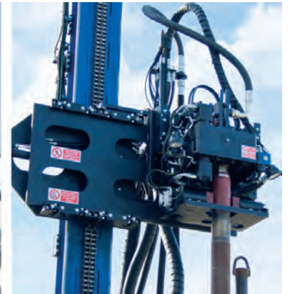
Groupe spécial tête modèle JOY 2 / Teilansicht Kopfgruppe Modell JOY 2

Les données et les images figurant dans le présent catalogue sont purement indicatives, Hydra se réserve le droit de les modifier sans préavis.